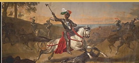
«La Disfida di Barletta» di A. Maffei - 1859 - particolare