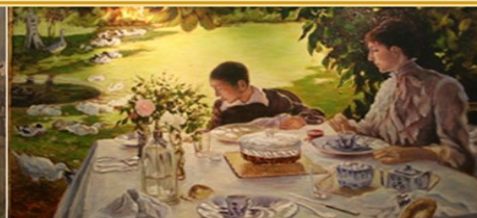
«Colazione in giardino» di G. De Nittis - 1883 - particolare