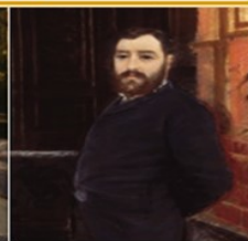
Giuseppe De Nittis (autoritratto - part.)