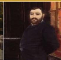
Giuseppe De Nittis (autoritratto - part.)