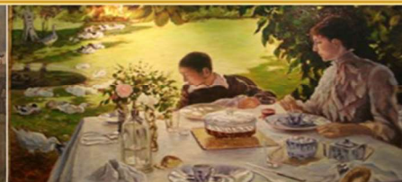
«Colazione in giardino» di G. De Nittis - 1883 - particolare