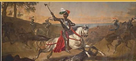
«La Dafida di Barletta» di A. Mario - 1859 - particolare